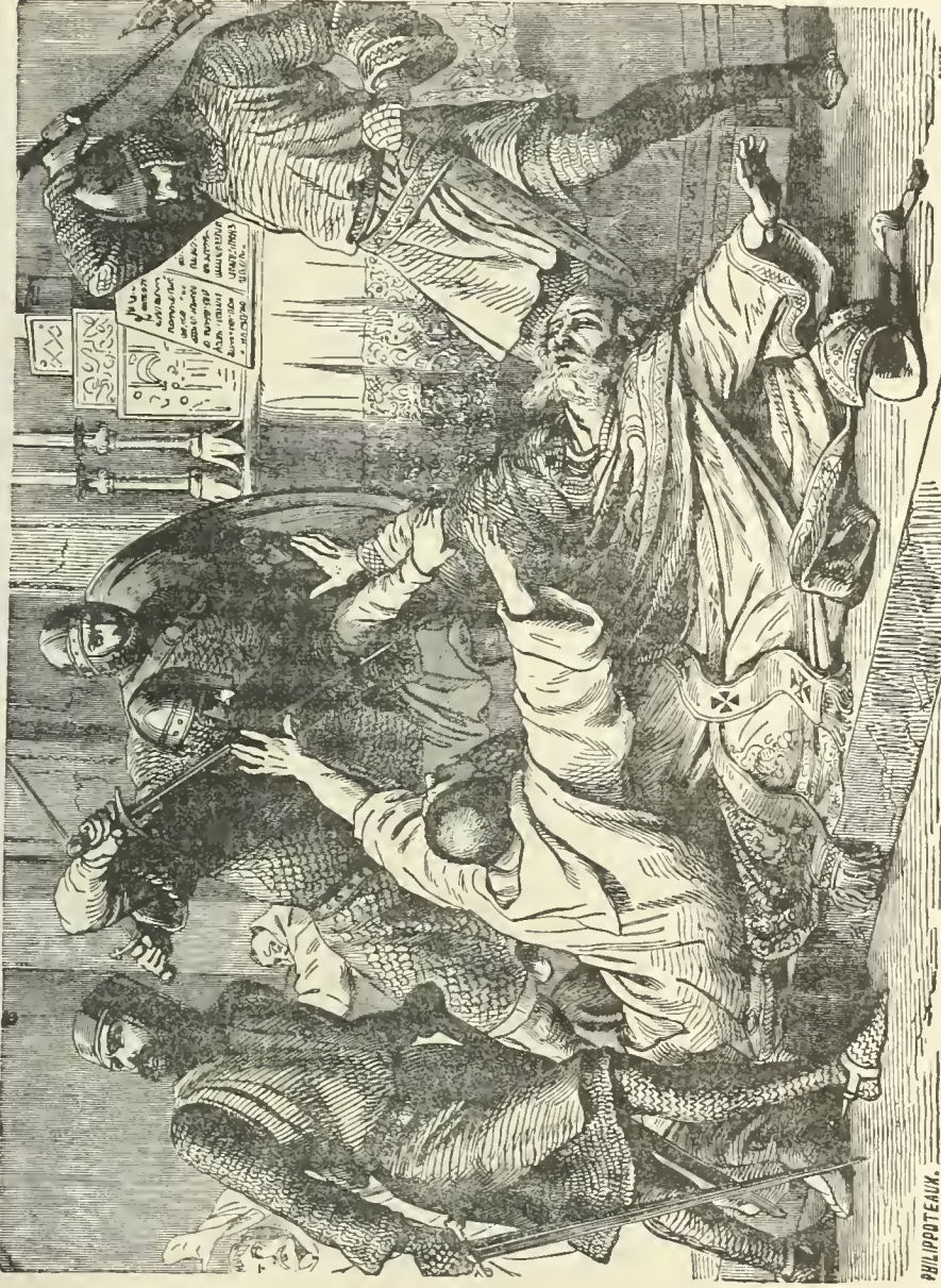
Un second coup porté à la tête renversa l'archevêque. (page 269)